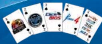
Les Meilleures Cartes En Main